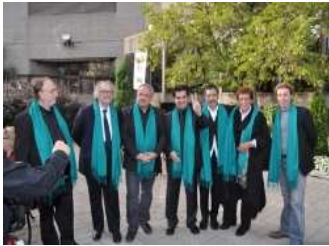
جعفر پناهی و جشنواره مونترال