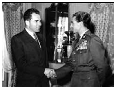
محمدرضا شاه و ریچارد نیکسون ۱۸