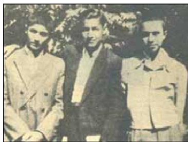
"سه آذر اهورایی":